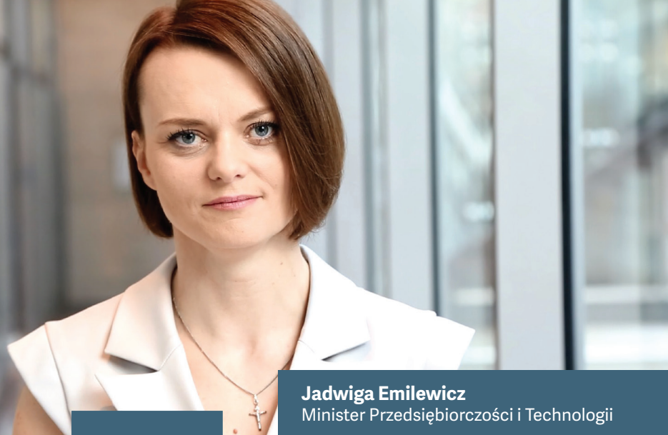
Jadwiga Emilewicz Minister Przedsiębiorczości i Technologii

W Ministerstwie Przedsiębiorczości i Technologii pracujemy z przedsiębiorcami i dla przedsiębiorców. Kontynuując działania podjęte przez Premiera Mateusza Morawieckiego pracujemy nad kolejnymi rozwiązaniami, które poprawią prawne i instytucjonalne otoczenie biznesu. Zmiany, które udało nam się wprowadzić w ciągu ostatnich dwóch lat przyniosły już konkretne efekty. To poprawa nastrojów wśród przedsiębiorców, wzrost znaczenia małych i średnich przedsiębiorców oraz większa liczba nowych firm. Konstytucja Biznesu pokazała, że jest wiele przestrzeni do poprawy warunków prowadzenia działalności gospodarczej w Polsce – wiele zmian już się dokonało, nad kolejnymi intensywnie pracujemy. Co ważne robimy to wspólnie z przedsiębiorcami, uważnie wsłuchując się w ich postulaty i potrzeby.